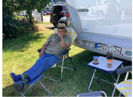
Nachmittag am WoMo