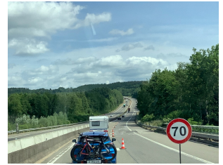
Autobahn bei Malmedy