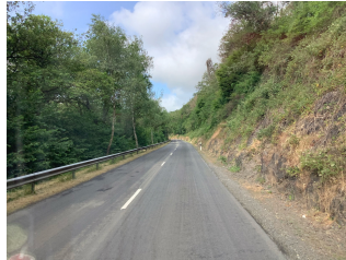
Durch den Hohen Venn